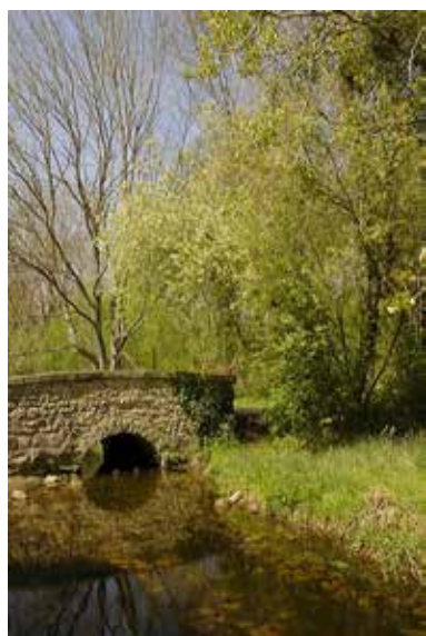
L'École amont : le pont de la Madeleine et le marais d'Oncy, un secteur sauvage riche en biodiversité

Au-delà de ces engagements et actions, c'est tout une logique autour de la notion de bassin versant qui émerge peu à peu, prenant en compte la rivière École elle-même et ses affluents.