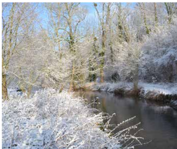
L'École aval à Saint-Sauveur-sur-École (SIARE/PNRGF)